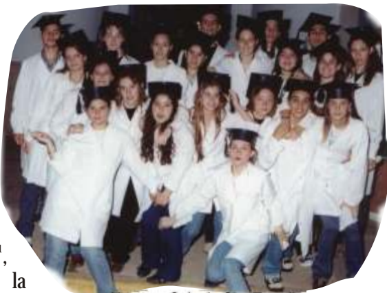
Alumnos Colegio Sta. Teresita (Hercilia - Sta. Fe)

49. Tomamos como punto de partida la matriz cultural del pueblo , manteniendo viva la memoria del pasado y la cultura que ha dado sentido al caminar del propio pueblo, para descubrir en él las semillas de un futuro inimaginable 41 , recreando constantemente la