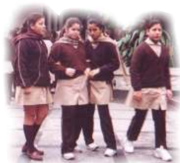
Alumnas Col. Sta Catalina Tucumán

Deseamos que nuestra marcha aliente a asumir los complejos procesos de construcción de identidades y los protagonismos diversos que van surgiendo a su paso. Creemos que junto a la marcha también es preciso detenernos para contemplar y construir sabidurías vitales desde el andar cotidiano.