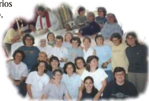
Capítulo General 2002

11. Nuestra fraternidad se hace más profunda cuando, a ejemplo de Santo Domingo que fue “padre y consolador de los frailes enfermos y de cuantos estaban atribulados” 19 , tenemos especial cuidado de las personas que sufren más necesidad y ponemos cuantos medios sean necesarios para su acompañamiento, brindándoles afecto y compañía. Porque hemos sufrido orfandades nos sentimos convocados a ser solidarios con los que sufren nuevas formas de orfandad.