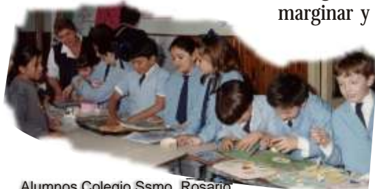
Alumnos Colegio Ssmo. Rosario (Monteros - Tucumán)

40. Mientras los nuevos escenarios producidos por la globalización neoliberal se organizan para competir y fragmentar, marginar y excluir, nuestras escuelas como