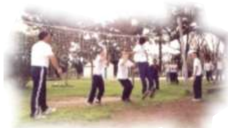
Alumnos Col. Ssmo. Rosario Rosario

57. Nos posicionamos ante las nuevas formas de tratamiento de la información y las nuevas realidades emergentes, en tanto expresiones de cambios culturales, promoviendo movimientos de cambio en las personas y replanteos de problemas técnicos, éticos y culturales .