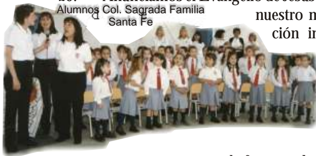
Alumnos Col. Sagrada Familia Santa Fe

25. Anunciamos el Evangelio de Jesús en los nuevos escenarios nuestro mundo. Nuestra predicación intenta pronunciar palabras de esperanza en medio de las múltiples fronteras de esos escenarios: “la frontera de la pobreza que resulta de la globalización económica; la frontera de la humanidad y dignidad humana en el campo de la bioética; la frontera de la experiencia cristiana enfrentada con el pluralismo religioso; y la frontera de la experiencia religiosa frente al ateísmo, la indiferencia materialista y las nuevas formas de idolatría” 30 . Estos son lugares prioritarios de reflexión teológica y de preocupación educativa.