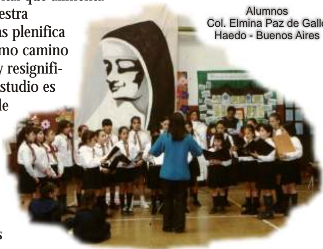
Alumnos Col. Elmina Paz de Gallo Haedo - Buenos Aires

Estudiamos porque esta práctica expresa la confianza en que nuestra vida y los sufrimientos de la gente y de los pueblos tienen un significado.