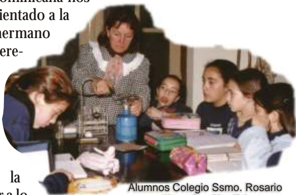
Alumnos Colegio Ssmo. Rosario (Rosario - Sta. Fe)

20. Nuestra vocación dominicana nos convoca a vivir el estudio orientado a la misión. Como nuestro hermano Santo Tomás de Aquino queremos plantear y discutir en nuestras aulas problemas nuevos , descubrir nuevos métodos , emplear una nueva urdimbre de pruebas . Como Tomás, sin ceder frívolamente a la novedad por la novedad, no queremos temer a lo