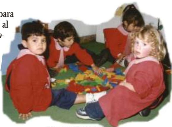
Alumnos Nivel Inicial Col. Ssmo Rosario - Rosario

51. Formamos en y para la libertad , considerando al educando sujeto de su desarrollo , ayudándolo a que tome la vida en sus manos poniéndola al servicio de los demás, en los diversos contextos en que le toque actuar. Fomentamos actitudes de apertura a la verdad del otro, aprendiendo a escuchar, porque creemos que el otro o la otra tienen